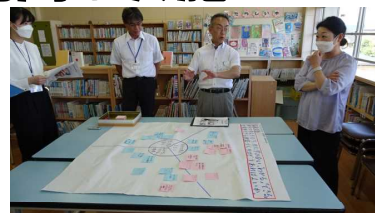
付箋紙を用いて授業分析を行う本校職員。