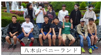
八木山ベニーランド